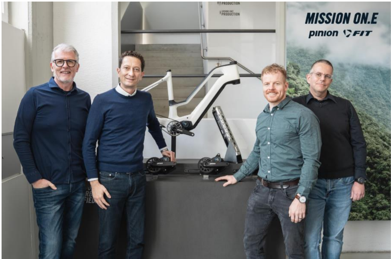
Foto 1: Neue Geschäftsführung der Rotax Bike Technology AG und der Pinion GmbH